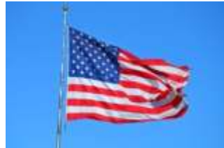
NY, Silicon Valley Remain Top US Fintech Hubs But Others Are Emerging Variöus