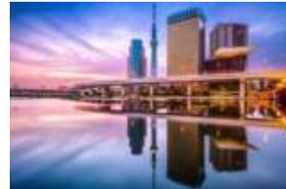
Fintech Startups in Asia Switzerland Should Watch Closely Wealthtech