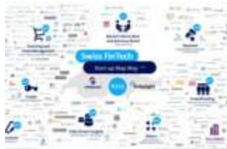
Swiss Fintech Startup Map, May 2018 Blockchain/Bitcoin, Variöus